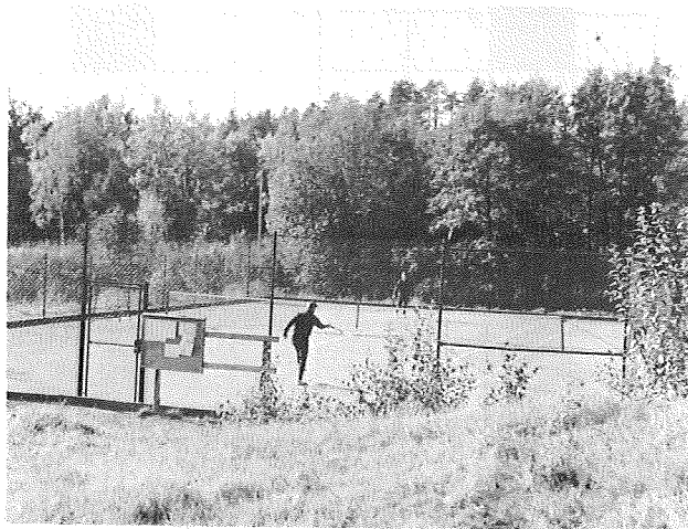
Tennis — fin avkoppling i underbar miljö.